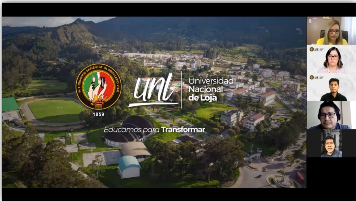
Figura 2 Socialización de la Propuesta Alternativa

Nota: Fecha del evento 6 de septiembre del 2021