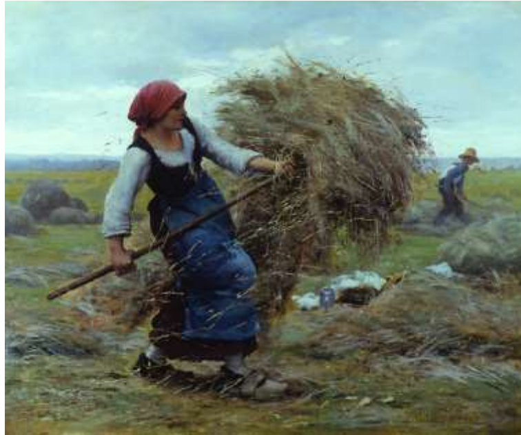
Ilustración 2. La cosecha del Heno. Dupre J. (1851 – 1910). Pintura. Realismo. Óleo sobre lienzo. 26x32 cm. Colección privada, Nueva York. Extraída https://rehs.com/virtexjd.htm .

Julien Dupre pintor francés nacido en París el 18 de marzo de 1851 y fallece el 16 de abril 1910. Sus obras, junto con la de Millet, ejercieron gran influencia en el desarrollo de la temática agraria del realismo social.