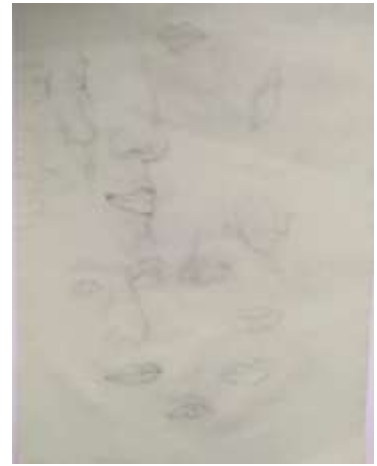
Fig.4. Estudio para boceto. Sanches P. (Fotografía).