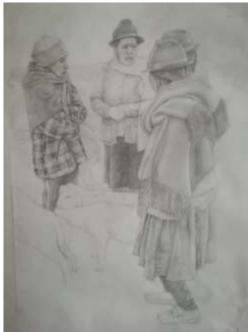
Fig.6. Boceto a lápiz para la obra. Sanches P. Fotografía