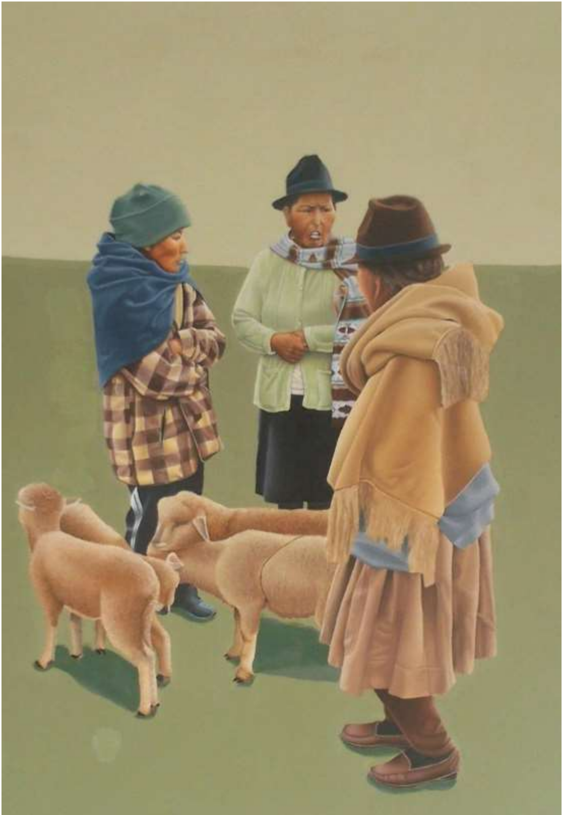
Fig. 2. S/T. (2019). Sanches P. Pintura. Realismo. Óleo sobre lienzo. (100 x 120cm). Fotografía.