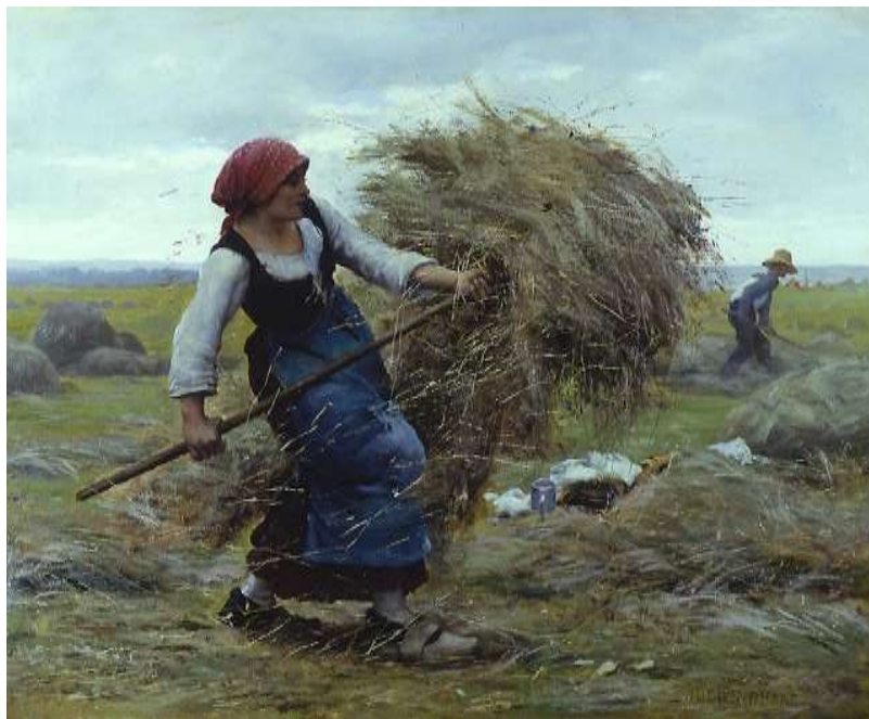
Fig. 2. La cosecha del Heno. Dupre J. (1851 – 1910). Pintura. Realismo. Óleo sobre lienzo. 26x32 cm. Colección privada, Nueva York.

Dupré es uno de los mejores retratistas de la temática animal en su tiempo. Observó y pintó con fidelidad la vida de los campesinos, y los dotó de vida dentro de sus obras. En sus pinturas es excepcional el juego con la luz y la profundidad, lo que refuerza los efectos y resalta la fuerza expresiva en sus obras.