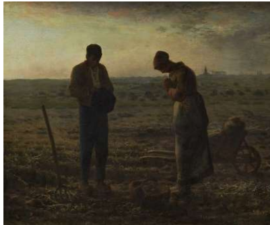
Ilustración. 1. El Ángelus. (). Millet J. Pintura. Realismo. Óleo sobre lienzo. 55.5x66cm. Museo de Orsay Paris-Francia. http://www.musee-orsay.fr/es/colecciones/obras-comentadas/busqueda/commentaire_id/langelus-339.html?no_cache=1

Son importantes para el desarrollo de esta investigación, ya que cada uno de ellos representa en sus obras los puntos expuestos como es el realismo social cotidiano en manos de Jean François Millet (1814-1875) su obra se caracteriza por el desarrollo de las escenas de la vida campesina se encuentra ligado a su realidad en la que vivía.