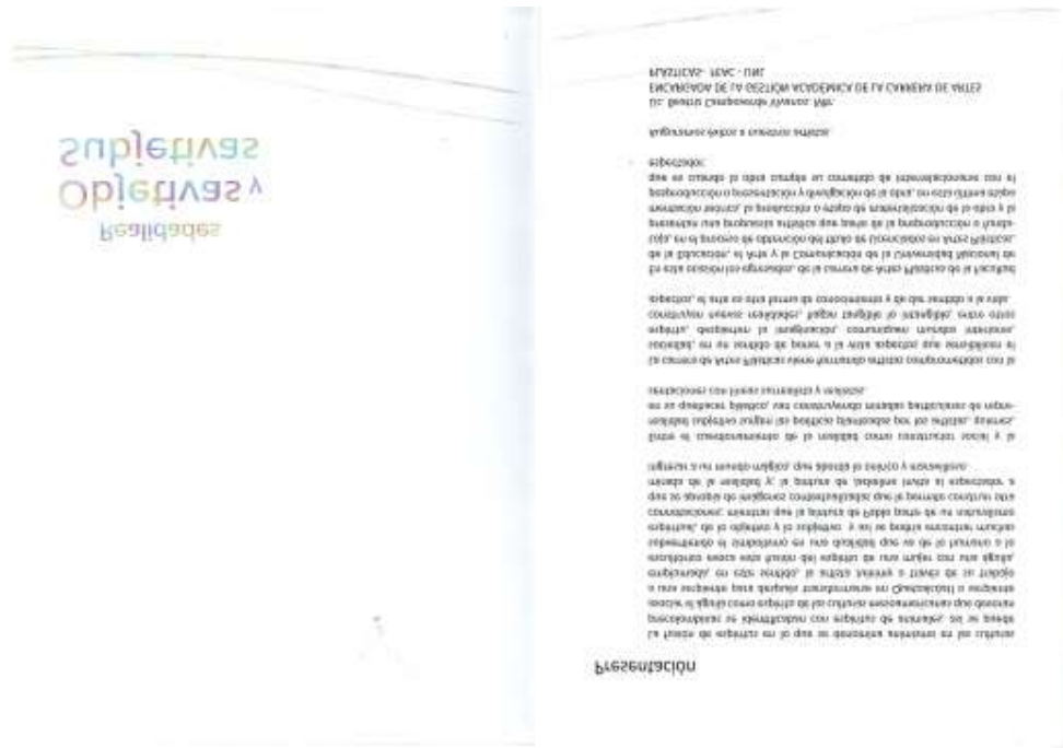
Fig.6. León G. (2019). Catálogo de Exposición; (Fotografía)