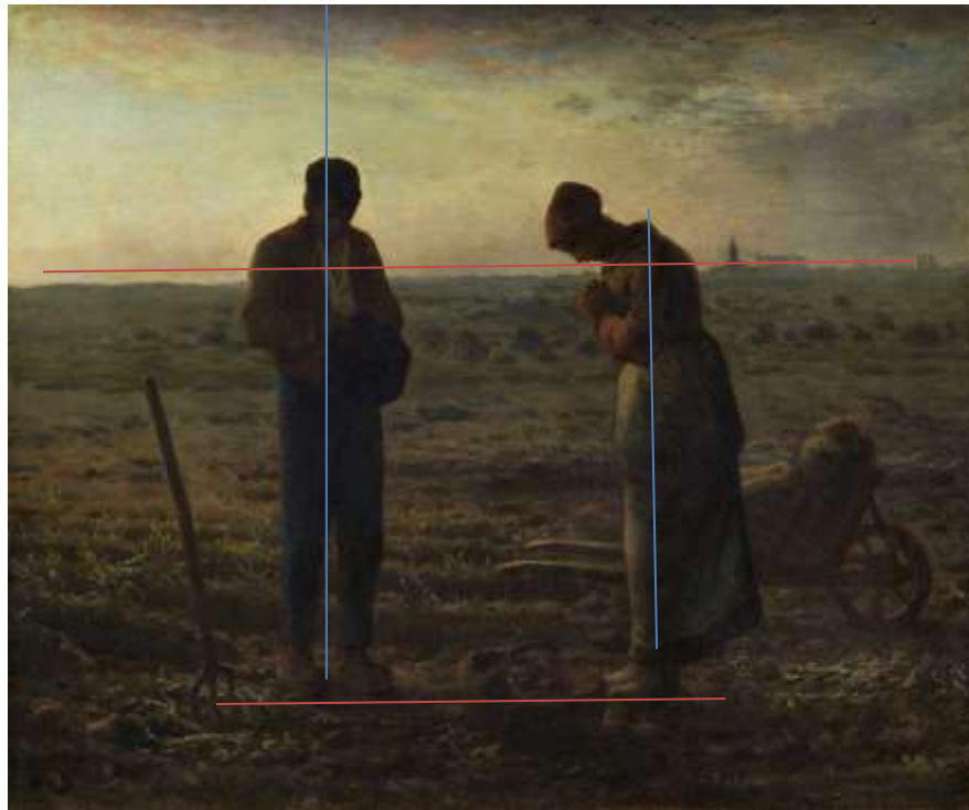
Imagen 3: Jean-Francois Millet. (1857-1859). El Ángelus. Óleo sobre lienzo. (55,5 x 66 cm). Realismo Frances. Museo de Orsay Paris-Francia. Extraído http://www.musee-orsay.fr/es/colecciones/obras-comentadas/busqueda/commentaire_id/langelus-339.html?no_cache=1