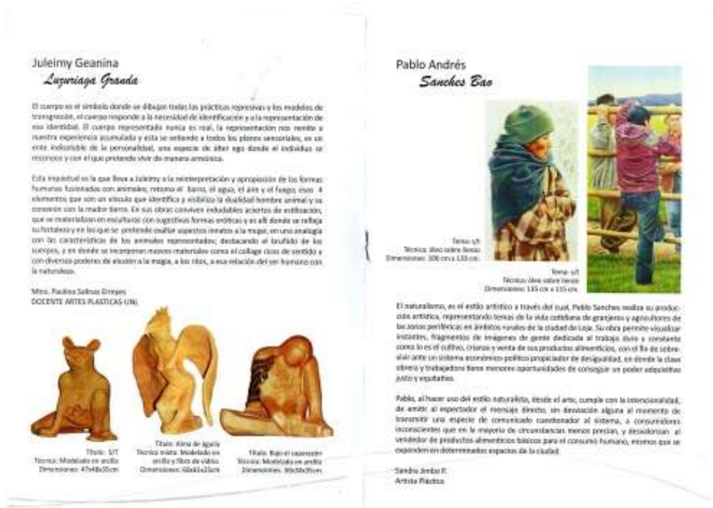
Fig.7. León G. (2019). Catálogo de Exposición; (Fotografía)