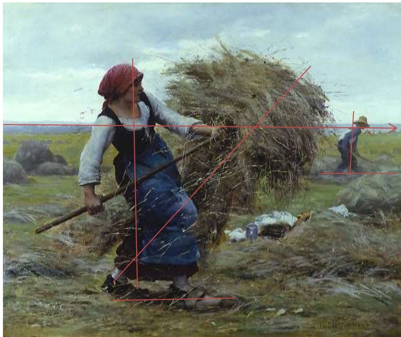
Ilustración 4: Julien Dupré. (1851 – 1910). La Cosecha del Heno. Óleo sobre lienzo. (26 x 32cm). Realismo. Colección privada, Nueva York.

Julien Dupré. (1851 – 1910). La Cosecha del Heno. Óleo sobre lienzo. (26 x 32cm).