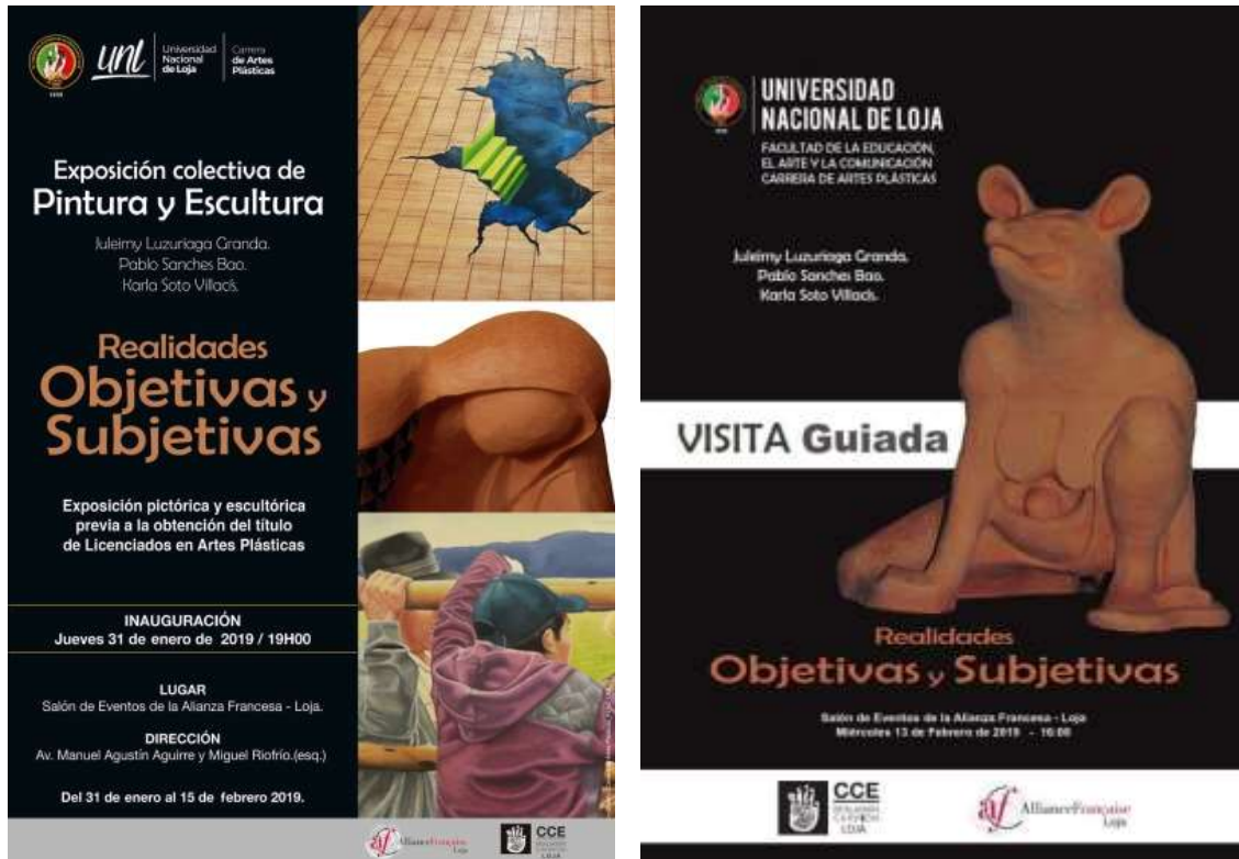
Fig. 3. Afiches. (2019). León G. Digital; Fotografía