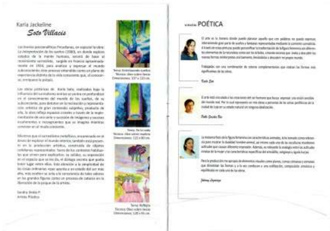
Fig.8. León G. (2019). Catálogo de Exposición.; (Fotografía)