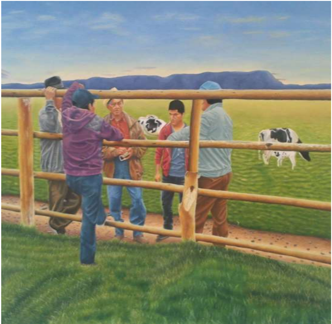
Fig1. S/T. (2019). Sanches P. S/T. Pintura. Realismo. Óleo sobre lienzo. 130 x122cm. Realismo. Fotografía.

La obra denominada “Ilustración 6” , Esta realizada en óleo sobre lienzo, a partir del postulado Marxista, en donde considera al hombre como ser natural, concedido de fuerzas naturales y vitales, de impulsos que llevan a actuar, por lo que se trata de representar al ser humano en su estado más natural, en la cotidianidad, así, en el primer plano se ubican las persona que se encuentran en actitud de negociar ganado, como una práctica de subsistencia.