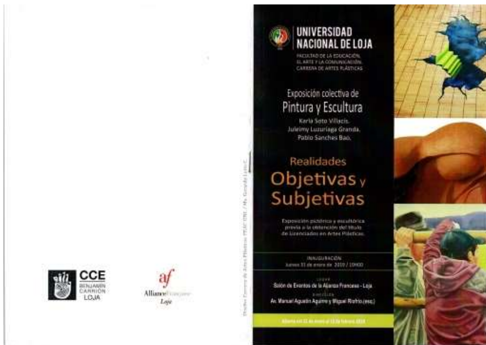
Fig.5 León G. (2019). Catálogo de Exposición; (Fotografía)