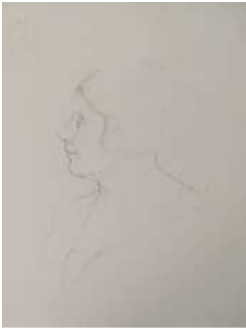
Fig.3. Estudio para boceto.