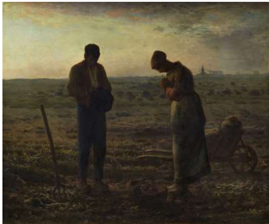
Fig. 1. El Ángelus. (). Millet J. Pintura. Realismo. Óleo sobre lienzo. 55.5x66cm. Museo de Orsay Paris-Francia. http://www.musee-orsay.fr/es/coleccion/obras-comentadas/busqueda/commentaire_id/langelus-339.html?no_cache=1

Se trata de un óleo pintado sobre lienzo que mide 66 centímetros de alto por 55.5 centímetros de ancho.