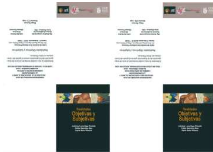
Fig.4. Modelo de invitación. León G. (2019). Digital.; Fotografía.