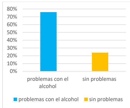
Figura 1 Test de Audit