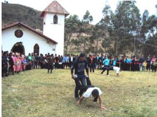
Figura # 67. Juego popular de la carretilla Fuente: Observación directa Elaboración: Laura Armijos