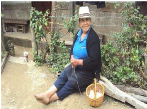
Figura # 9. Pobladora confeccionando tejidos en lana.