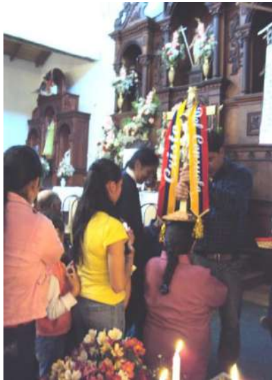
Figura # 55. Devotos efectuando el acto de hacerse pisar del Santo Fuente: Observación directa Elaboración: Laura Armijos