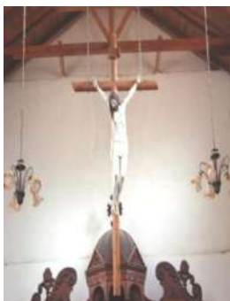
Figura # 24. Crucifijo de la iglesia central de la parroquia Fuente: Observación directa Elaboración: Laura Armijos