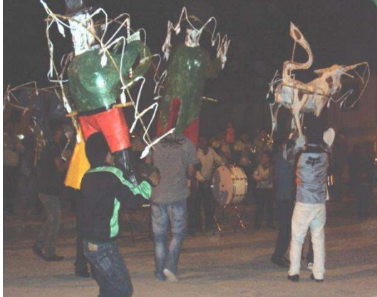
Figura # 50. Baile con las chivas de fiesta Fuente: Observación directa Elaboración: Laura Armijos