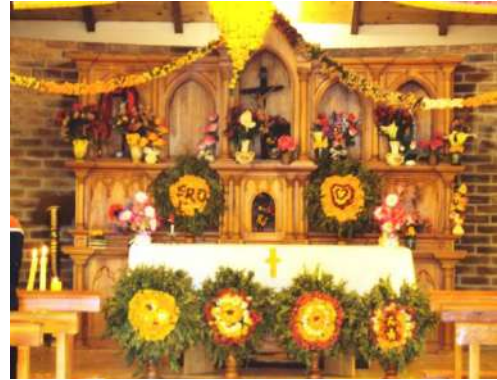
Figura # 60. Arreglos florales diseñados por las muñidoras