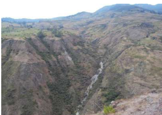
Figura # 2. Orografía de la parroquia Elaboración: Junta Parroquial El Paraíso de Celén

Al estar situada en las estribaciones de la cordillera Occidental de los Andes a 30 grados Latitud Norte de Loja su situación geográfica es idéntica a la del cantón Saraguro circundada por una cadena montañosa de corta elevación con hermosos paisajes y verdes sembrados.