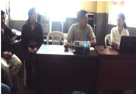
Figura # 83. Recepción de comentarios y sugerencias Elaboración: Laura Armijos