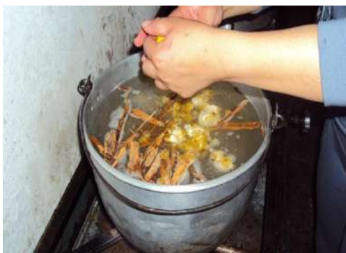
Figura # 12. Preparación del canelazo

Sambo: con este se prepara una nutritiva colada mezclada con leche y con panela