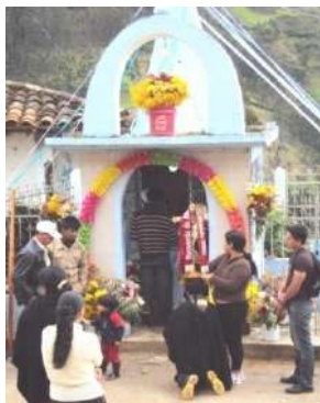
Figura # 27. Urna de Cristo del Consuelo