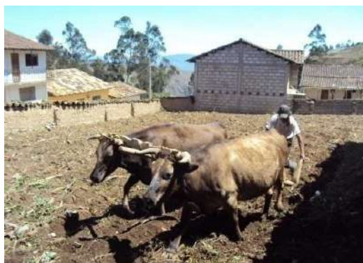
Figura # 6. Yunta de toros arando la tierra.