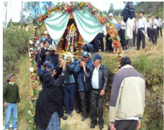
Figura # 43. Procesión con el Santo el segundo día de fiesta Fuente: Observación directa Elaboración: Laura Armijos