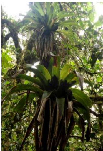
Figura # 4. Hojas de güicundo, utilizadas para envolver tamales.

La ubicación de la parroquia favorece la existencia de un sinnúmero de plantas utilizadas sabiamente por los habitantes, pues conocen su nombre y propiedades, lo que propicia a que se las destine para un determinado fin sea este maderable, artesanal, de consumo alimenticio y terapéutico; entre estas es oportuno mencionar las plantas maderables como romerillo, laurel, chachacomo, duco, plantas introducidas tales como eucalipto, pino ciprè, plantas de índole silvestre circundando la parroquia, en su mayoría destinadas para múltiples usos, entre éstas se enumera la llashipa, dumaril, aliso, gallinaso, flor de mayo, güicundo, musgo, totora, diente de león, flor de cristo, paja, penco, capulí, gañil, berro, paico, turpe, chulco, nogal, sauco, valeriana, verbena, carrizo, paja de cerro, etc en cuanto a las plantas medicinales de huerta se distingue la santamaría, begonia, amor