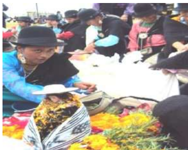
Figura # 31. Celebración del mote mikuna