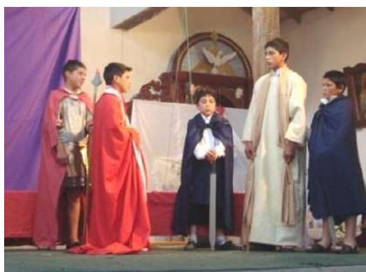
Figura # 37. Representación religiosa de Semana Santa