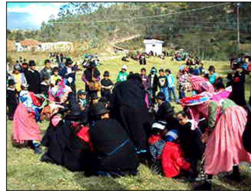
Figura # 64. Danzantes efectuando el baile de la mudanza