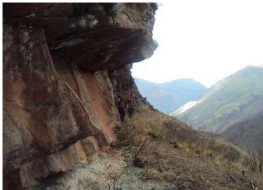
Figura # 15. Entrada a la Cueva de Shaquillo