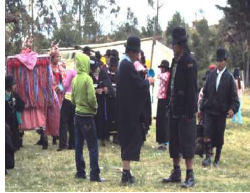
Figura # 70. Priestes celebrando con la bebida de mayorca