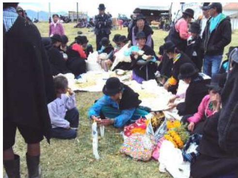
Figura # 65. Realización del mote mikuna Fuente: Observación directa Elaboración: Laura Armijos