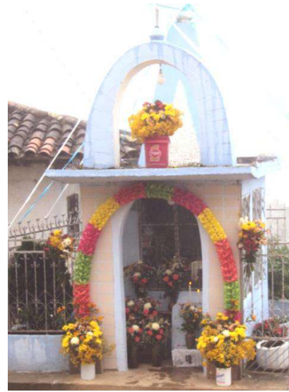
Figura # 42. Urna de Cristo del Consuelo adornada con flores de mayo Fuente: Observación directa Elaboración: Laura Armijos