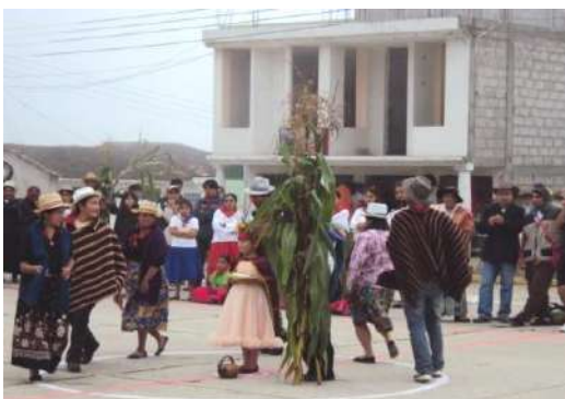
Figura # 16. Danza alusiva al maíz