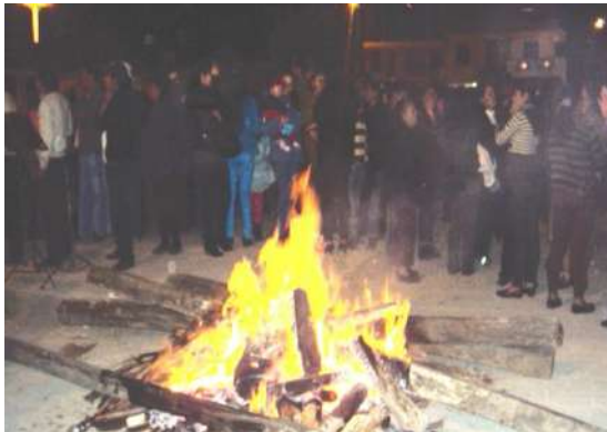
Figura # 59. Quema de chamiza Fuente: Observación directa Elaboración: Laura Armijos