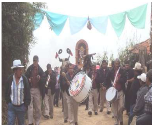
Figura # 44. Procesión con el Santo el primer día de fiesta Fuente: Observación directa Elaboración: Laura Armijos.