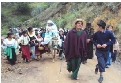
Figura # 36. Procesión con la imagen del Niño o Jesús