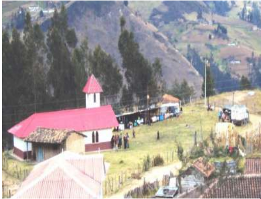
Figura # 61. Espacio ocupado para la fiesta en honor a Santa Rosa