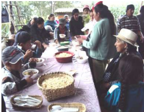
Figura # 46. Comilona ofrecida en el hogar del sacerdote Fuente: Observación directa Elaboración: Laura Armijos