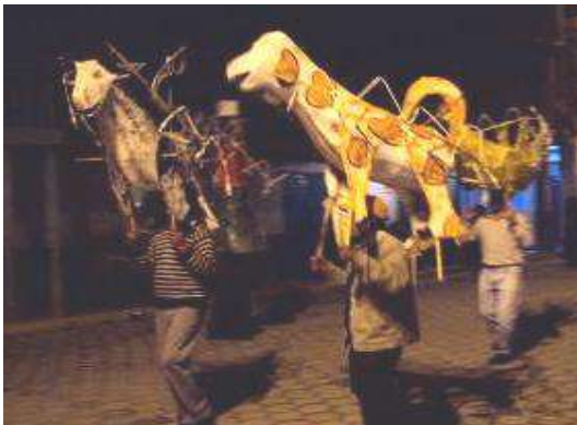
Figura # 78. Baile con las chivas Fuente: Observación directa Elaboración: Laura Armijos