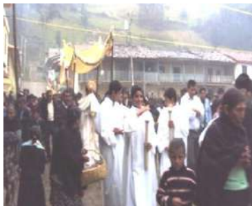
Figura # 29. Procesión con el Corpus Christi