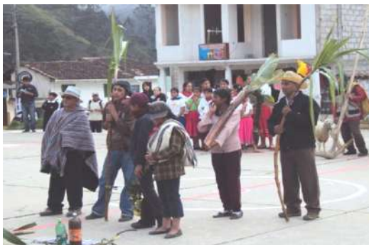
Figura # 19. Pobladores mostrando las cañas de para extraer el guaparo

trasladan a lugares estratégicos de la parroquia para desde allí partir con dirección al centro parroquial ambas portando las antorchas respectivas, al arribar a la parroquia encienden la antorcha principal ubicada en la cancha deportiva ,para luego con las palabras del presidente de la Junta Parroquial dirigidas a todos los presentes marcar el inicio de las festividades; inmediatamente se da comienzo con una comparsa organizada por los pobladores de los barrios y centro de la parroquia, ellos a su vez visten diferentes trajes que hacen alusión a la vida cotidiana del pueblo, así como de comunidades vecinas, para tal actividad llevan frutos propios de su tierra como