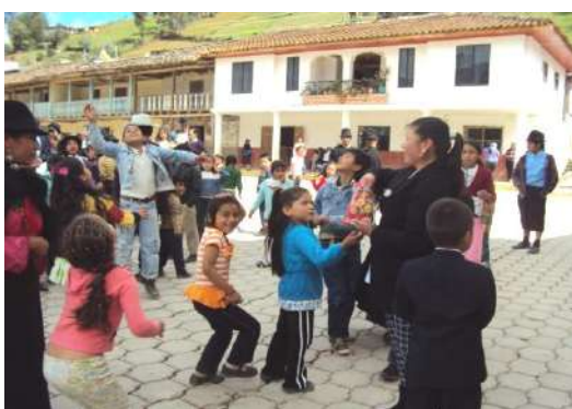
Figura # 20. Capillos efectuados por los padrinos de los bautizados