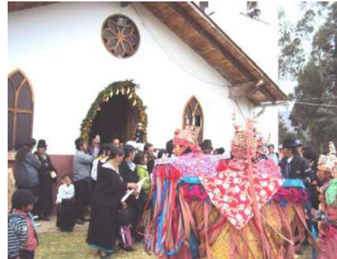
Figura # 66. Procesión con Santa Rosa de Lima Fuente: Observación directa Elaboración: Laura Armijos