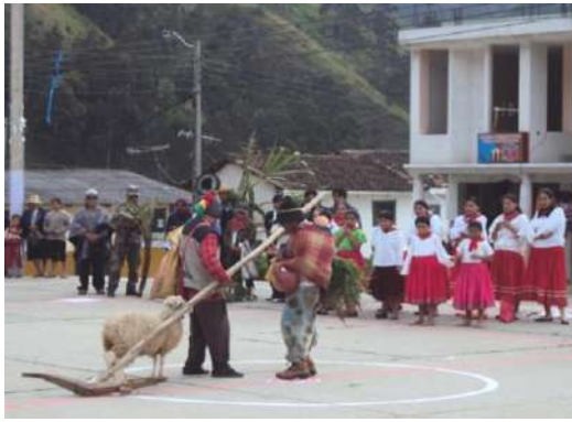
Figura # 18. Sainete cómico Elaboración: Laura Armijos