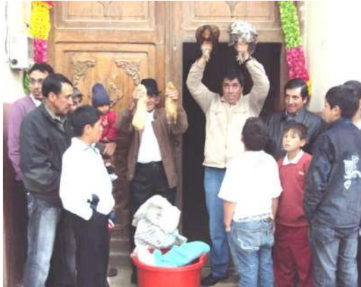
Figura # 49. Remates en el bazar Fuente: Observación directa Elaboración: Laura Armijos