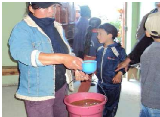
Figura # 45. Chicha brindada a los invitados Fuente: Observación directa Elaboración: Laura Armijos