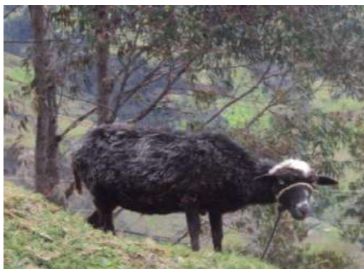
Figura # 5. Oveja negra criada para confeccionar con su lana prendas indígenas