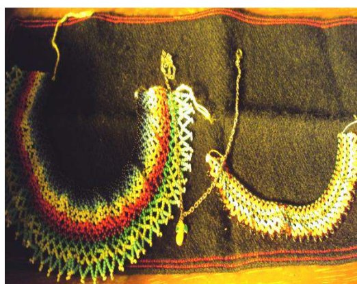
Figura # 72. Collares diseñados por los devotos para la Santa