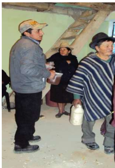
Figura # 47. Canelazo brindado a los pobladores Fuente: Observación directa Elaboración: Laura Armijos