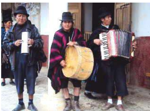
Figura # 22. Banda indígena acompañando a los novios

Los matrimonios en la parroquia generalmente se los realiza en épocas festivas como pueden ser navidad, fiestas religiosas de la parroquia o durante ciertas temporadas del año. Los desposorios son una muestra más de la cultura e identidad de los mestizos e indígenas, donde cada género pone de manifiesto tradiciones y costumbres inherentes a su cultura.