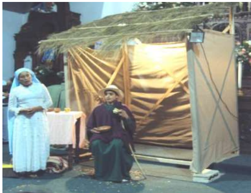
Figura # 80. Representación religiosa navideña