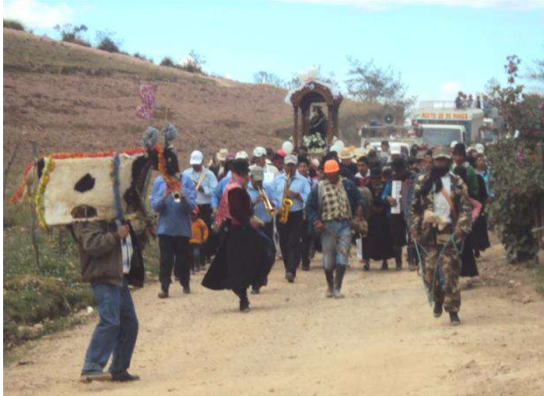
Figura # 76. Procesión con la Virgen del Cisne al barrio Zunín