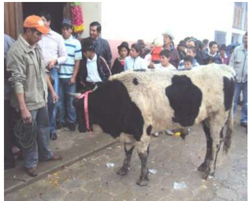
Figura # 48. Toro donado para el remate Fuente: Observación directa Elaboración: Laura Armijos