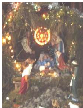
Figura # 34. Pesebre natural elaborado en la iglesia