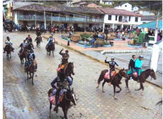
Figura # 57. Inicio de la carrera de caballos Fuente: Observación directa Elaboración: Laura Armijos