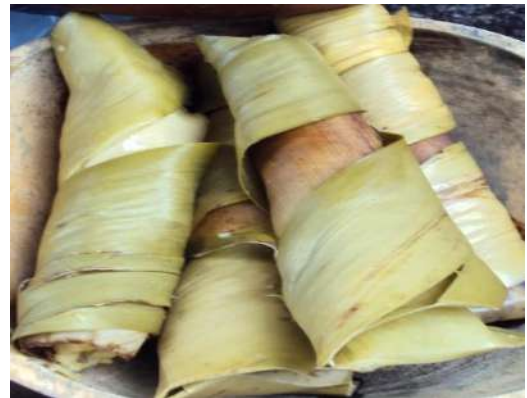
Figura # 81. Tamales preparados en hojas de güicundo