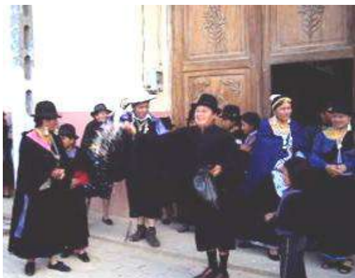
Figura # 21. Padrino de novios indígenas ofreciendo capillos de caramelos