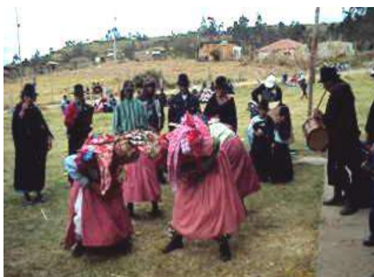
Figura # 74. Danza del toro Fuente: Observación directa Elaboración: Laura Armijos