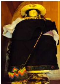
Figura # 30. Imagen de Santa Rosa de Lima