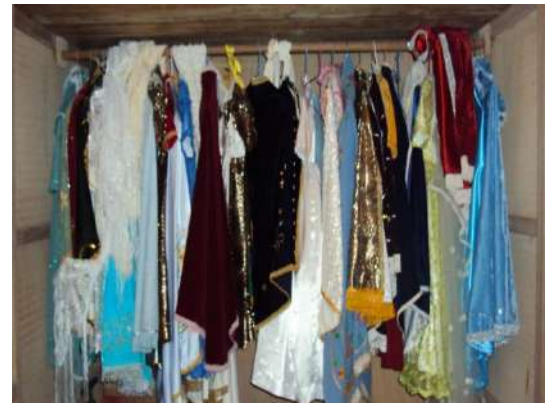
Figura # 77. Prendas de la Virgen del Cisne Fuente: Observación directa Elaboración: Laura Armijos