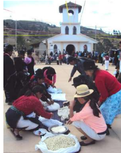
Figura # 75. Realización del mote mikuna por los sacerdotes Fuente: Observación directa Elaboración: Laura Armijos