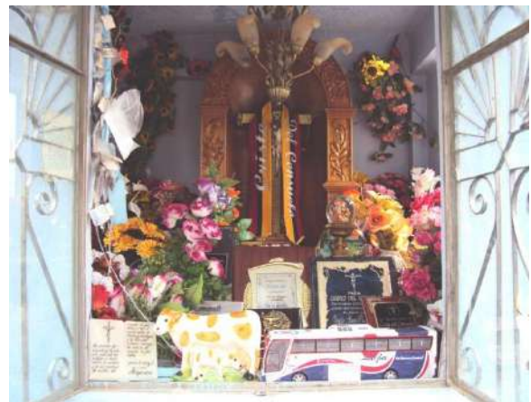
Figura # 54. Objetos colocados al interior de la urna Fuente: Observación directa Elaboración: Laura Armijos