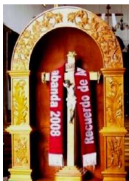
Figura # 26. Imagen de Cristo del Consuelo