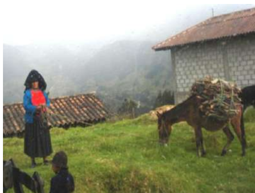
Figura # 7. Crianza de ganado caballar