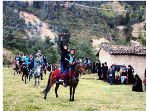
Figura # 69. Jinetes participando en la carrera de caballos