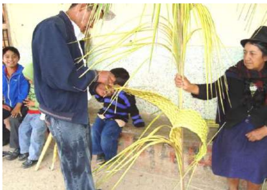
Figura # 39. Poblador tejiendo los ramos Fuente: Observación directa Elaboración: Laura Armijos