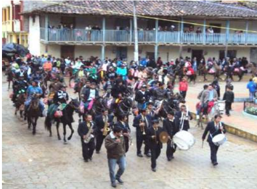
Figura # 56. Banda de música acompañando a los jinetes