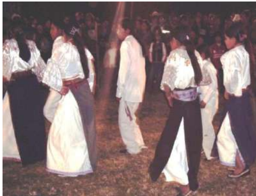
Figura # 63. Grupo de danza Juvenil Sumak Tushuri