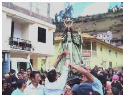
Figura # 33. Colocación de ofrendas a la Virgen del Cisne