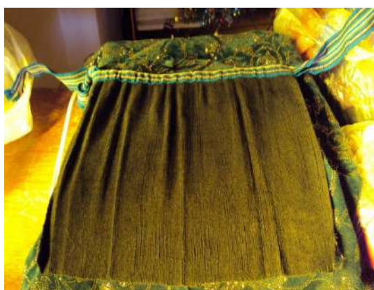
Figura # 73. Pollera confeccionada por los devotos para la Santa Fuente: Observación directa Elaboración: Laura Armijos