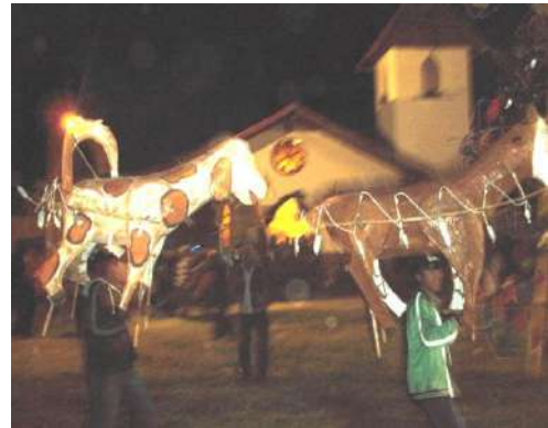
Figura # 62. Baile con las chivas de fiesta