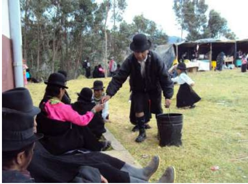
Figura # 71. Ofrecimiento de chicha a los pobladores