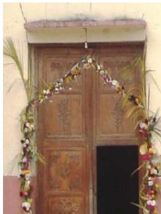
Figura # 40. Arco de flores y ramos adornando la entrada de la iglesia Fuente: Observación directa Elaboración: Laura Armijos