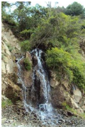
Figura # 3. Quebrada Paja Ladera

A más de poseer un hermoso paisaje, en la parroquia se aprecian varias fuentes hidrográficas como son el Río Celén y sus quebradas Paja Ladera, Gualel Mocho, Chorro Blanco, Tres Quebradas, El Tambo, Guisti Cuchillo, Yanasache, Zaras y Bolarrume.