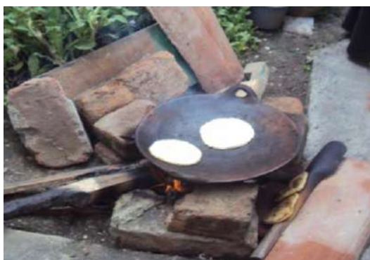
Figura # 10. Tortillas de walo Fuente: Observación directa Elaboración: Laura Armijos

Generalmente los pobladores indígenas y mestizos comparten un similar régimen alimentario, de cuyos productos se derivan varios alimentos, algunos de estos consumidos específicamente en épocas festivas, mientras que otros se los prepara ocasionalmente durante el año; dentro de éstos se detallan los siguientes: