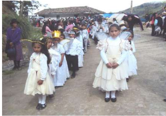
Figura # 79. Niños acompañando en la procesión de Navidad