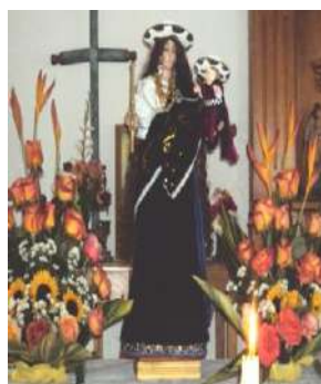
Figura # 32. Imagen de la Virgen del Cisne

Fuente: Observación directa Elaboración: Laura Armijos