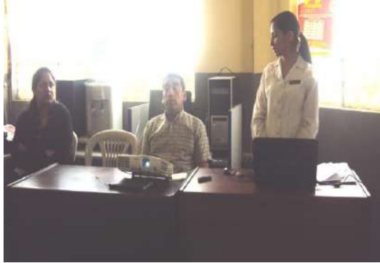
Figura # 82. Exposición de la propuesta Elaboración: Laura Armijos