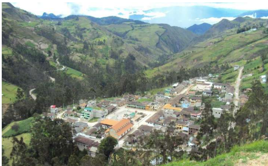
Figura # 23. Vista panorámica de la Cabecera central de la parroquia