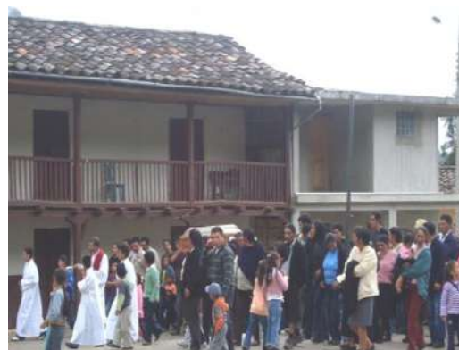
Figura # 38. Procesión con la imagen del cuerpo de Jesús Fuente. Observación directa Elaboración: Laura Armijos