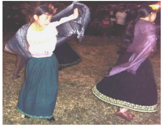
Figura # 52. Grupo de danza juvenil Sumak Tushuri