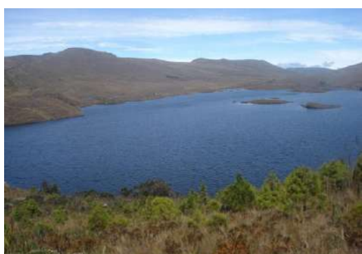
Figura # 13. Vista panorámica de las Lagunas de Chinchilla

Por motivo de no haberse efectuado proyecto alguno concerniente a la actividad turística en la parroquia, esta no posee atractivos o lugares catalogados como turísticos, siendo únicamente las Lagunas de Chinchilla las que se registran en este ámbito, a continuación se hará una breve descripción de las mismas: