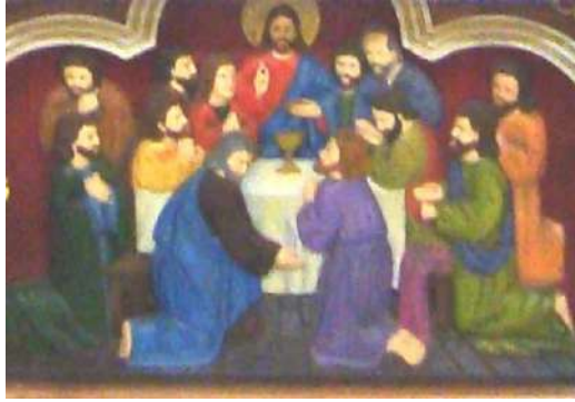
Figura # 8. Tallado de arte religioso de la iglesia central.