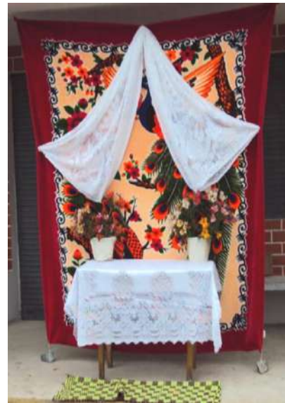
Figura # 58. Altar levantado para recibir al Santísimo Fuente: Observación directa Elaboración: Laura Armijos