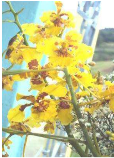
Figura # 41. Flores de mayo Fuente: Observación directa Elaboración: Laura Armijos