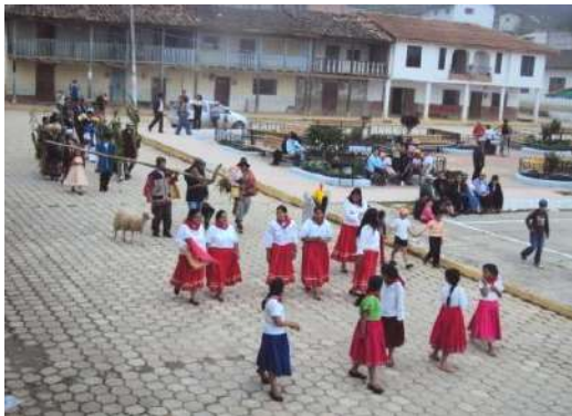
Figura # 17. Pregón de festividades de parroquialización