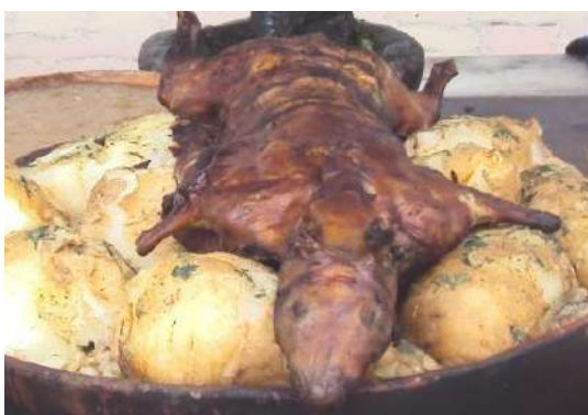
Figura # 11. Cuy con papas Fuente: Observación directa Elaboración: Laura Armijos

Los platos guisados con carnes se elaboran en base a las siguientes especies de animales: