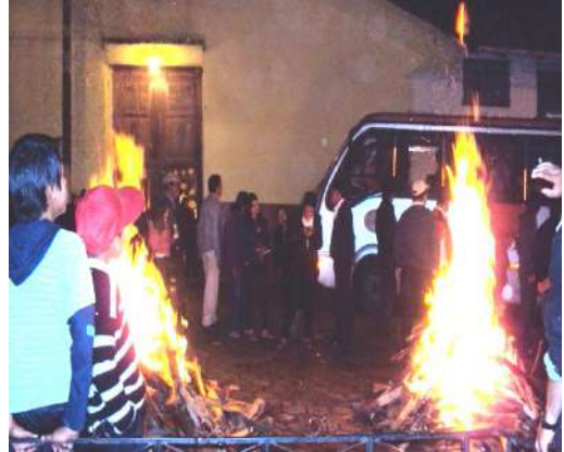
Figura # 51. Quema de chamiza