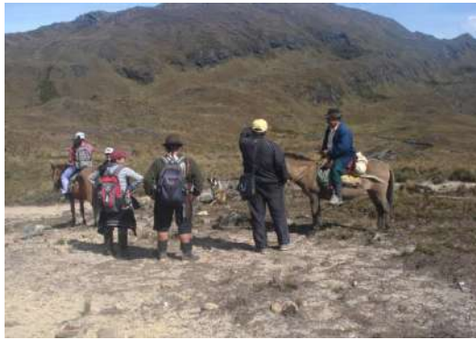
Figura # 14. Visitantes rumbo a las Lagunas de Chinchilla