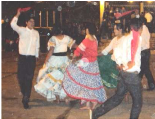
Figura # 53. Grupo de danza Juvenil San Vicente Ferrer Fuente: Observación directa Elaboración: Laura Armijos