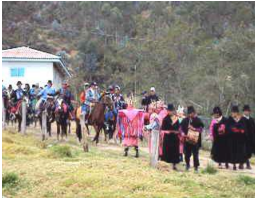
Figura # 68. Danzantes y maestro guiador acompañando a los jinetes