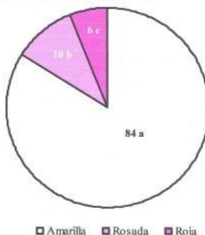
Figura 2. Representación del porcentaje para color de la piel del tubérculo

En la Figura 2 se presenta el porcentaje para el color de la piel del tubérculo: el 84 % de los genotipos mostraron el amarillo, en 11 materiales se apreció el rosado para un 10 % y el rojo se manifestó en siete individuos para un 6 %.