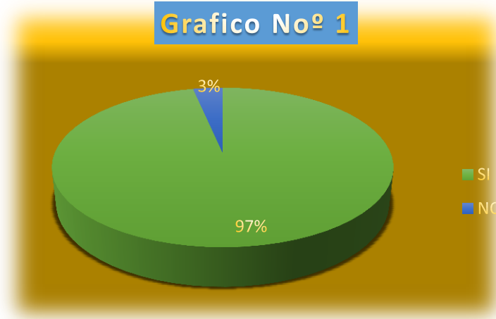
Grafico Noº 1