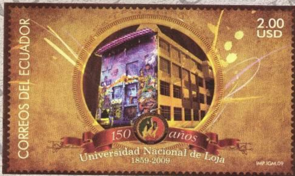
Sello Postal de la Universidad Nacional de Loja, emitido por la Empresa Nacional de Correos de Ecuador