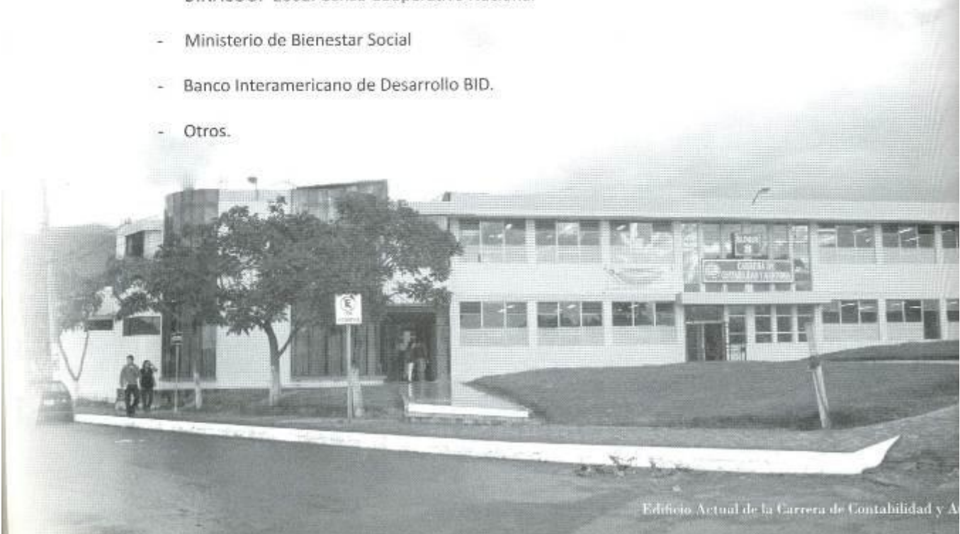
Edificio Actual de la Carrera de Contabilidad y A