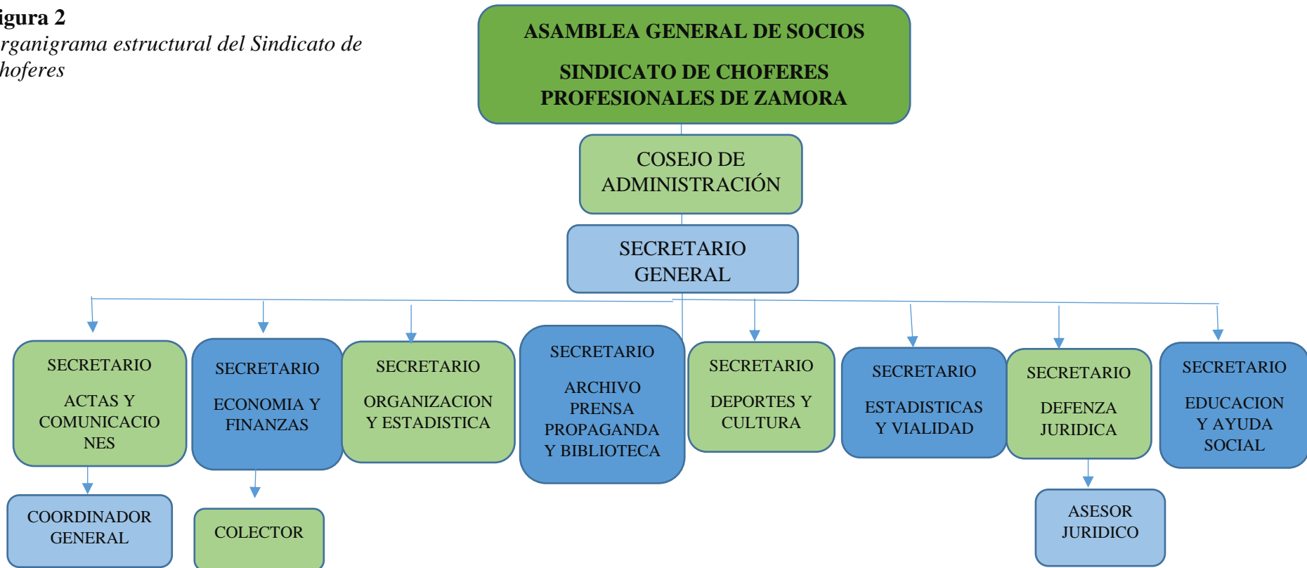
Figura 2 Organigrama estructural del Sindicato de Choferes