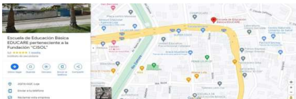
Figura 1. Ubicación geográfica de la Unidad Educativa fiscomisional “Cisol Educare”